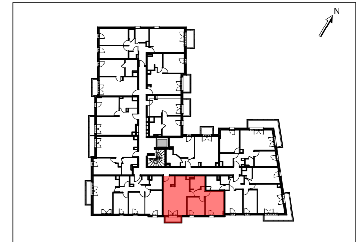
TABLEAU DE SURFACES