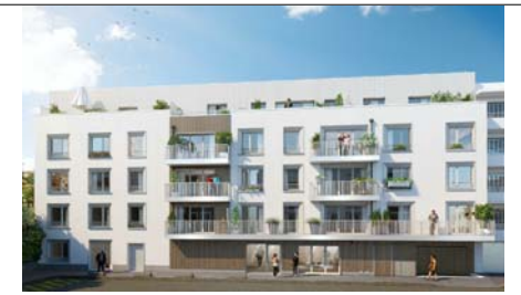
6 rue de la Semeuse 93 700 DRANCY