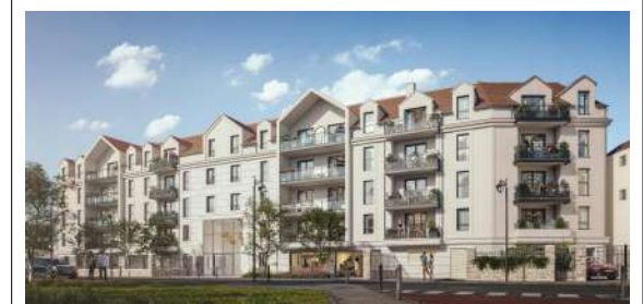
3, 3Bis, 5 rue Pasteur ROISSY-EN-BRIE 77680