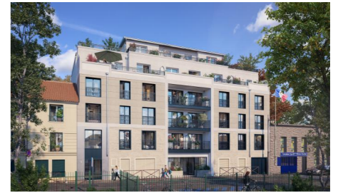
9, 11, 13 rue de Lorraine 78200 Mantes-la-Jolie