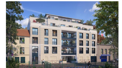
9, 11, 13 rue de Lorraine 78200 Mantés-la-Jolie