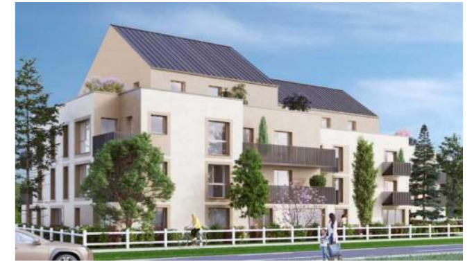
Macrolot n°2, route de Littry, Lotissement « Les Libérateurs », BAYEUX (14400)