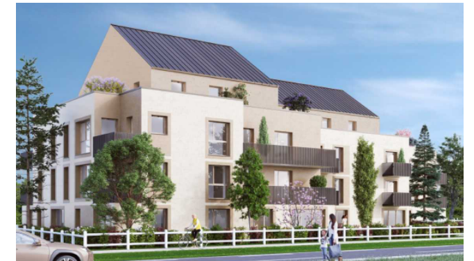
Macrolot n°2, route de Littry, Lotissement « Les Libérateurs », BAYEUX (14400)