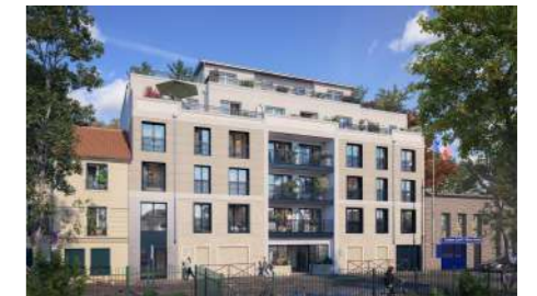
9, 11, 13 rue de Lorraine 78200 Mantés-la-Jolie