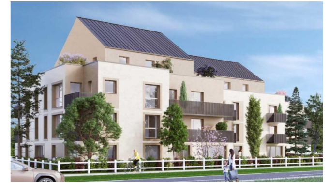
Macrolot n°2, route de Littry, Lotissement « Les Libérateurs », BAYEUX (14400)