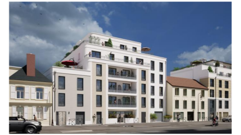
3/5 RUE DE LORRAINE 78200 MANTES-LA JOLIE