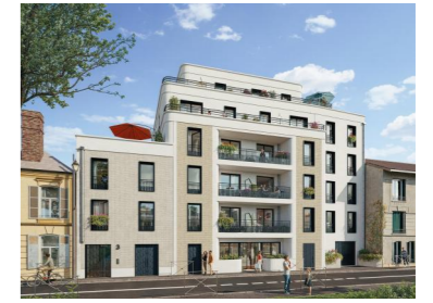
3/5 RUE DE LORRAINE 78200 MANTES-LA JOLIE