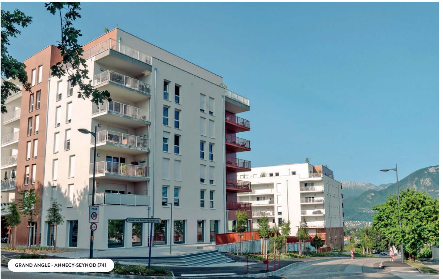
GRAND ANGLE - ANNECY-SEYNOD (74)