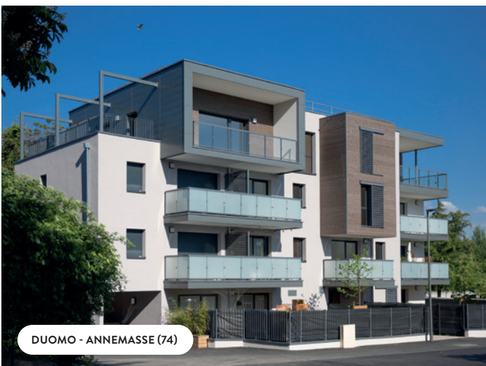
DUOMO - ANNEMASSE (74)