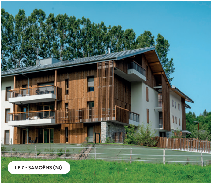
LE 7 - SAMOËNS (74)