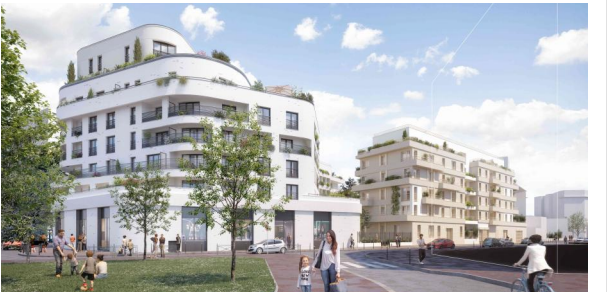
14 rue Adolphe Briffault - Asnières-sur-Seine 92600