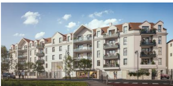
3, 3Bis, 5 rue Pasteur ROISSY-EN-BRIE 77680