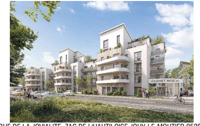
RUE DE LA JOVIALITE ZAC DE L'HAUTOULOISE JOUY-LE-MOUTIER 95280