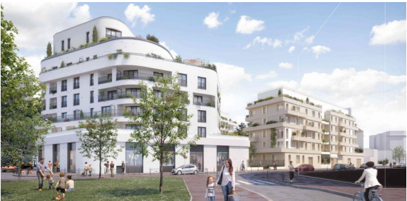
14 rue Adolphe Briffault - Asnières-sur-Seine 92600