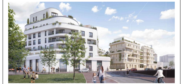
14 rue Adolphe Briffault - Asnières-sur-Seine 92600