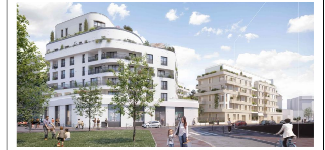
14 rue Adolphe Briffault - Asnières-sur-Seine 92600