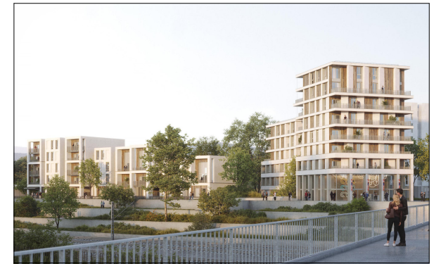
Rue Niki de Saint-Phalle