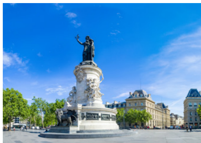
Place de la République.

Depuis la station « Bobigny - Pantin Raymond Queneau », la ligne 5 rejoint en 5 min* la Porte de Pantin et en 16 min* la place de la République : la promesse de pouvoir rejoindre sereinement Paris tout en profitant de l'apaisement de l'est parisien. Avec la ligne de métro 11 et dix lignes de bus, les moyens de se déplacer sont variés. Quant à la proximité de l'A3, elle facilite les trajets en voiture vers la grande couronne et l'aéroport international de Paris-Charles de Gaulle. À l'horizon 2031, les Romainvillois profiteront de la ligne 15 du Grand Paris Express depuis la gare « Rosny-Bois-Perrier ».