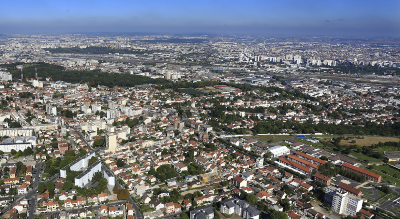
Vue aérienne de Romainville.