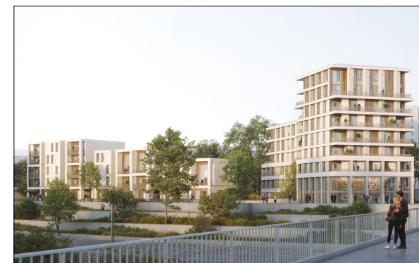
Rue Niki de Saint-Phalle

Les surfaces, cotes, gaines, retombées, soffites, faux-plafonds ainsi que l'implantation des équipements sanitaires ne sont pas systématiquement représentés, ou le sont à titre indicatif. Le présent plan est susceptible de faire l'objet de modifications en fonction des contraintes administratives, techniques de conception et des tolérances d'exécution, tant en ce qui concerne les dimensions libres que les équipements, les réseaux, ainsi que les appareillages sanitaires et électriques. Seuls les équipements mentionnés dans la notice descriptive annexée à l'acte de vente auront valeur contractuelle.