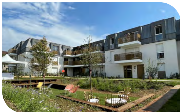
Gardenia - Argenteuil (95)

*Exigences appliquées sur toutes nos opérations