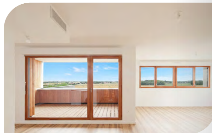
Demain - Bussy-Saint-Georges (77)