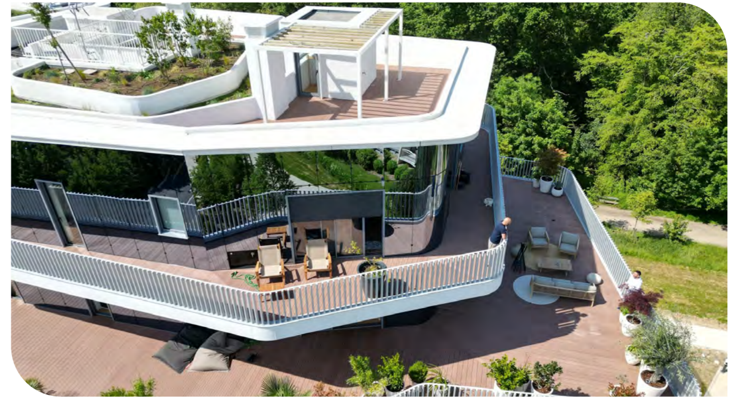
Canopée - Vélizy-Villacourblay (78)