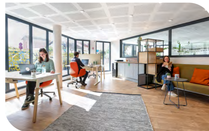
Coworking enbâ - Clos Fleuri - Bezons (95)